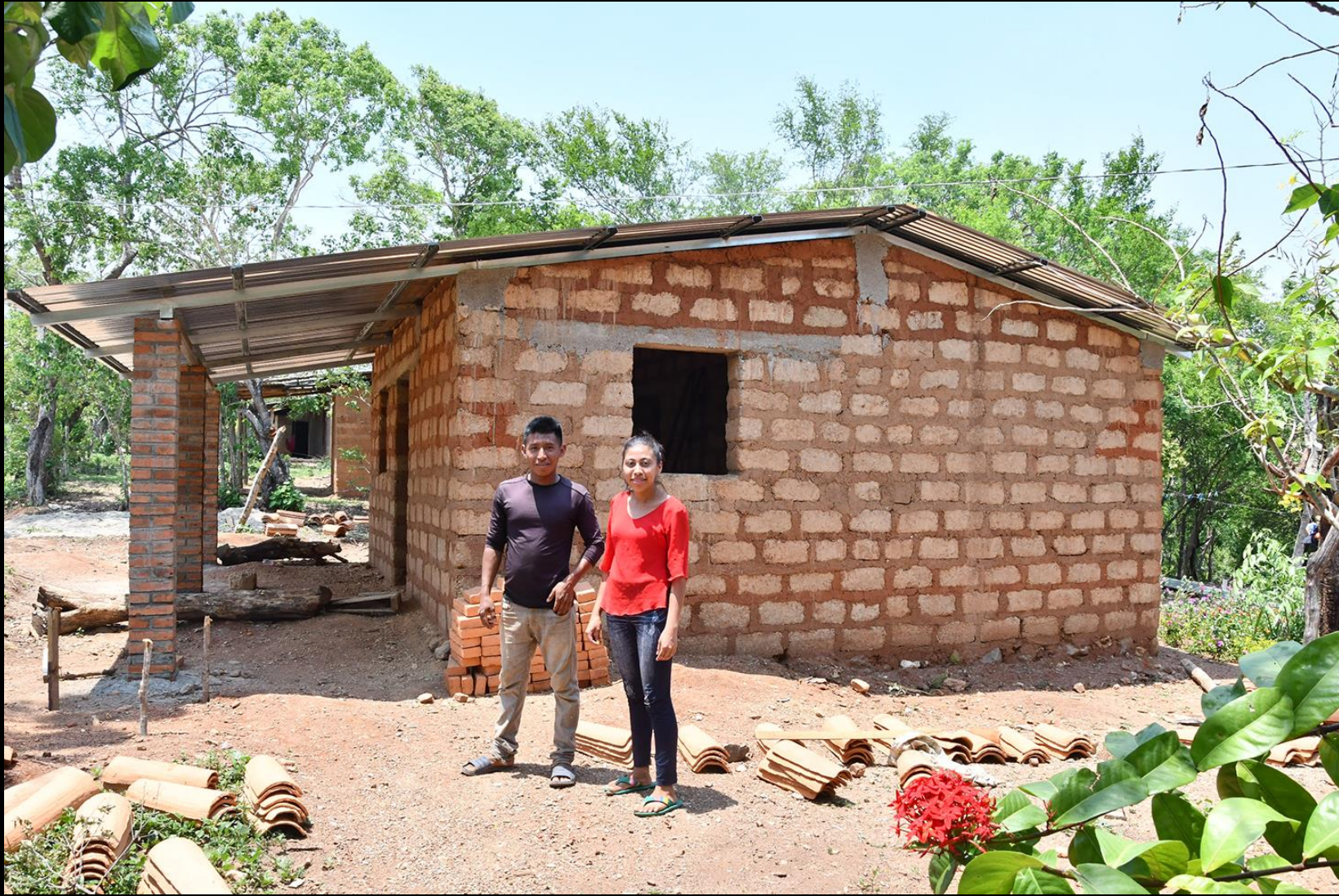
Fase de construcción vivienda 2