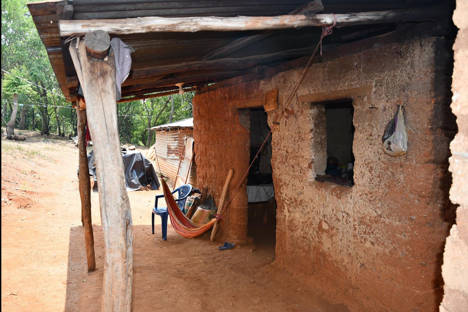
Vivienda 1 (vieja)