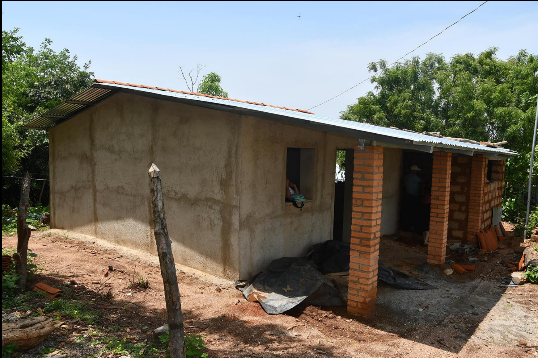
Fase de construcción vivienda 1