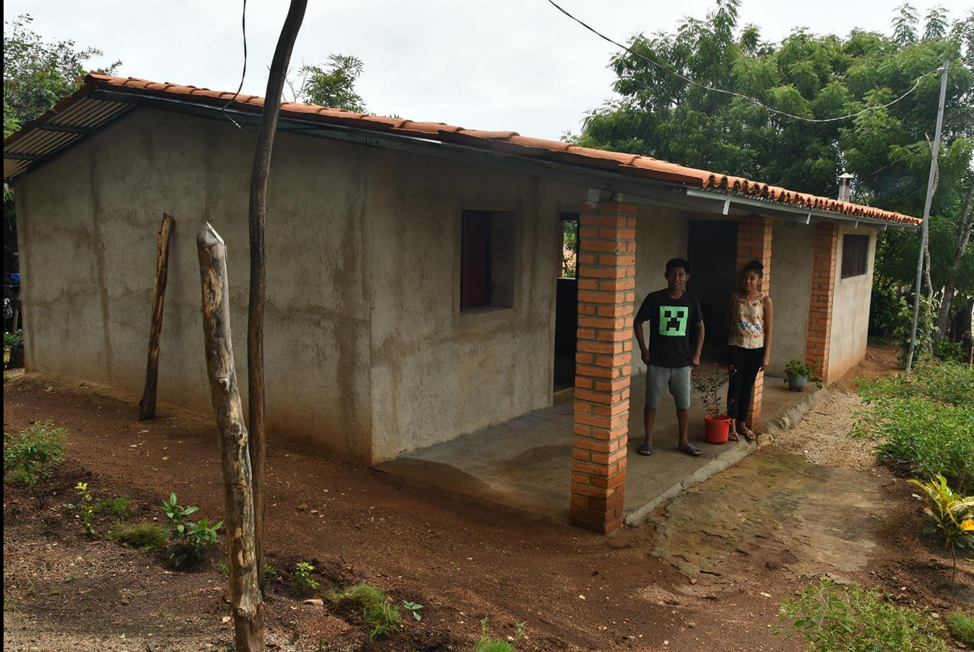
Vivienda nueva construida