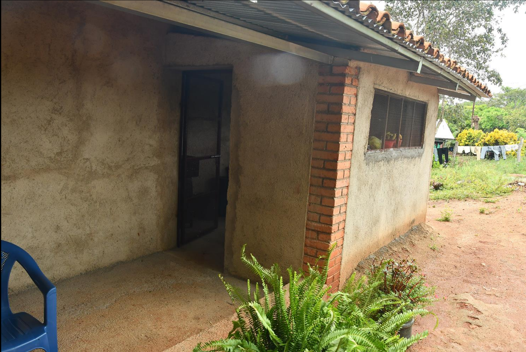
Porche y cocina casa 2