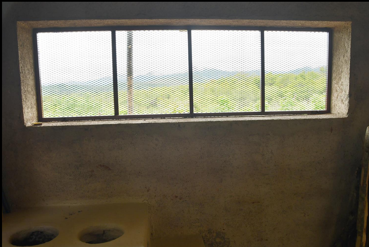
Ventanal de cocina casa 2