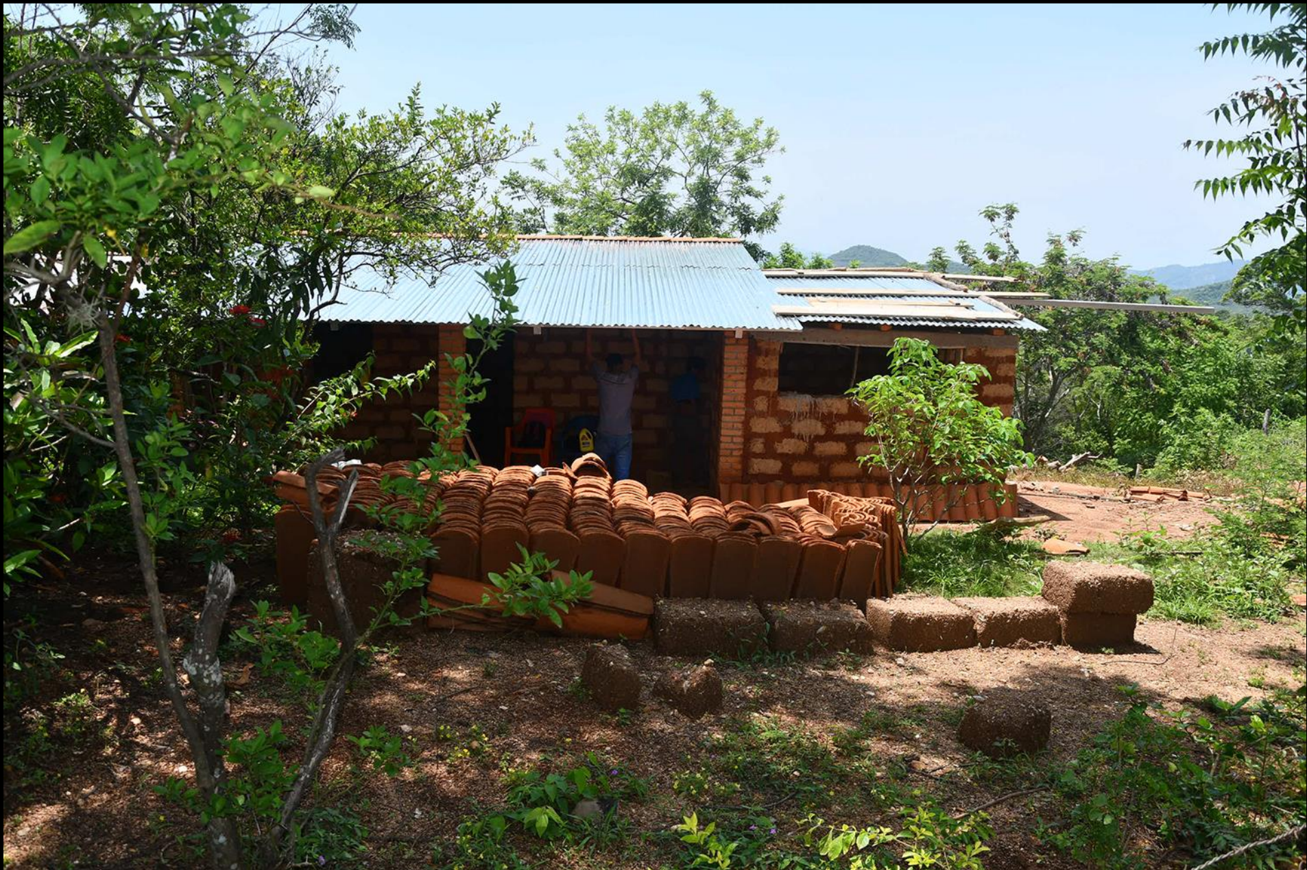
Fase de construcción