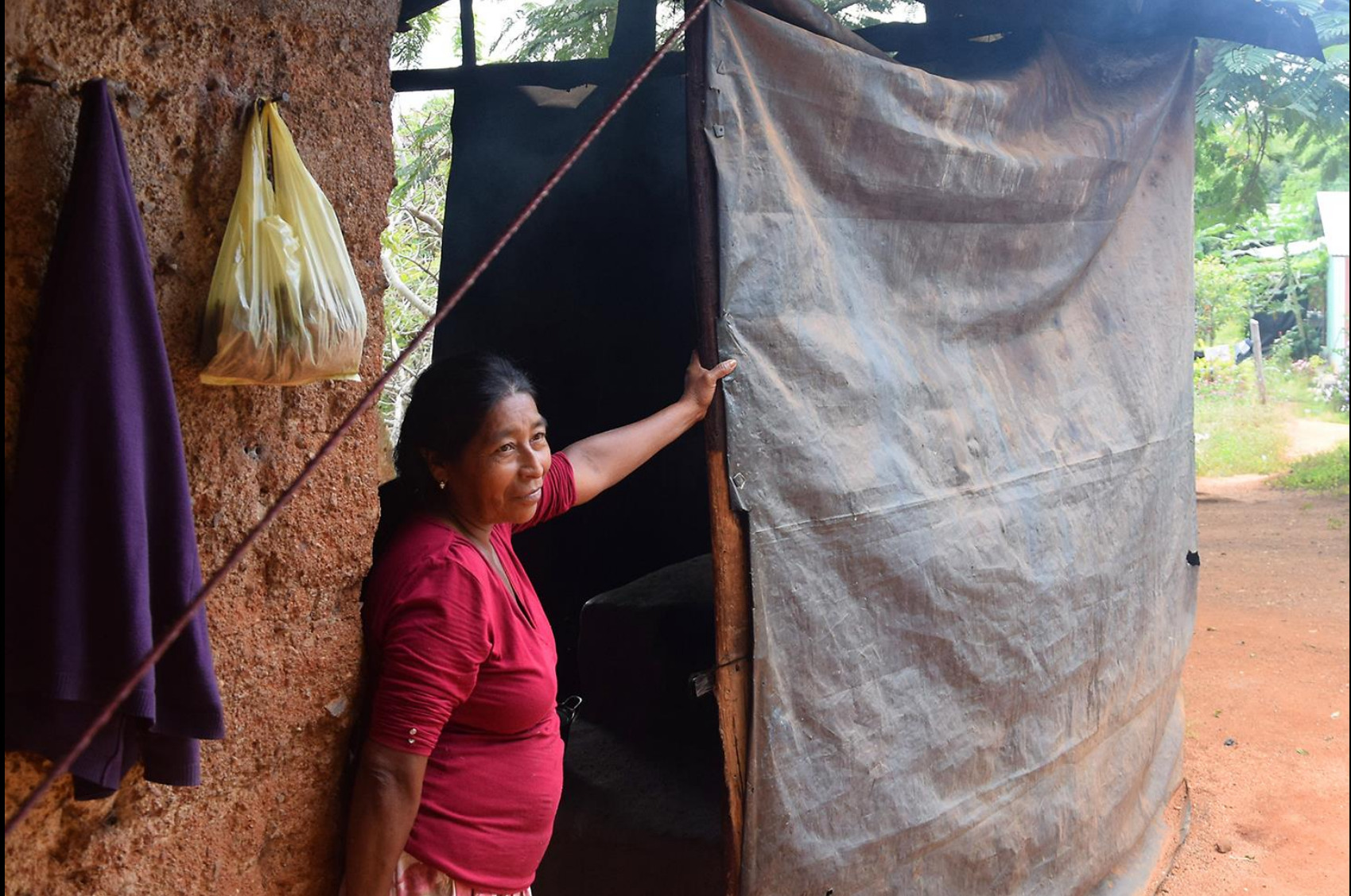
Vivienda 1 (vieja) cocina