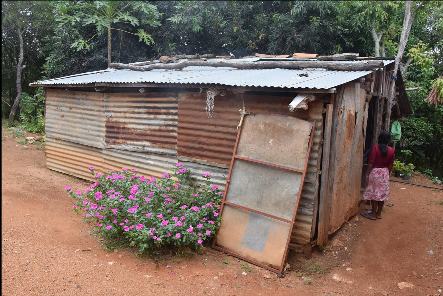
Vivienda 2 (vieja)