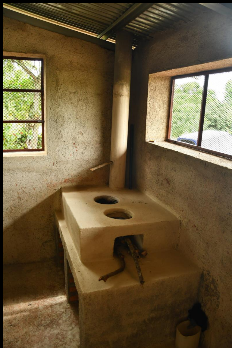
Cocina vivienda 2