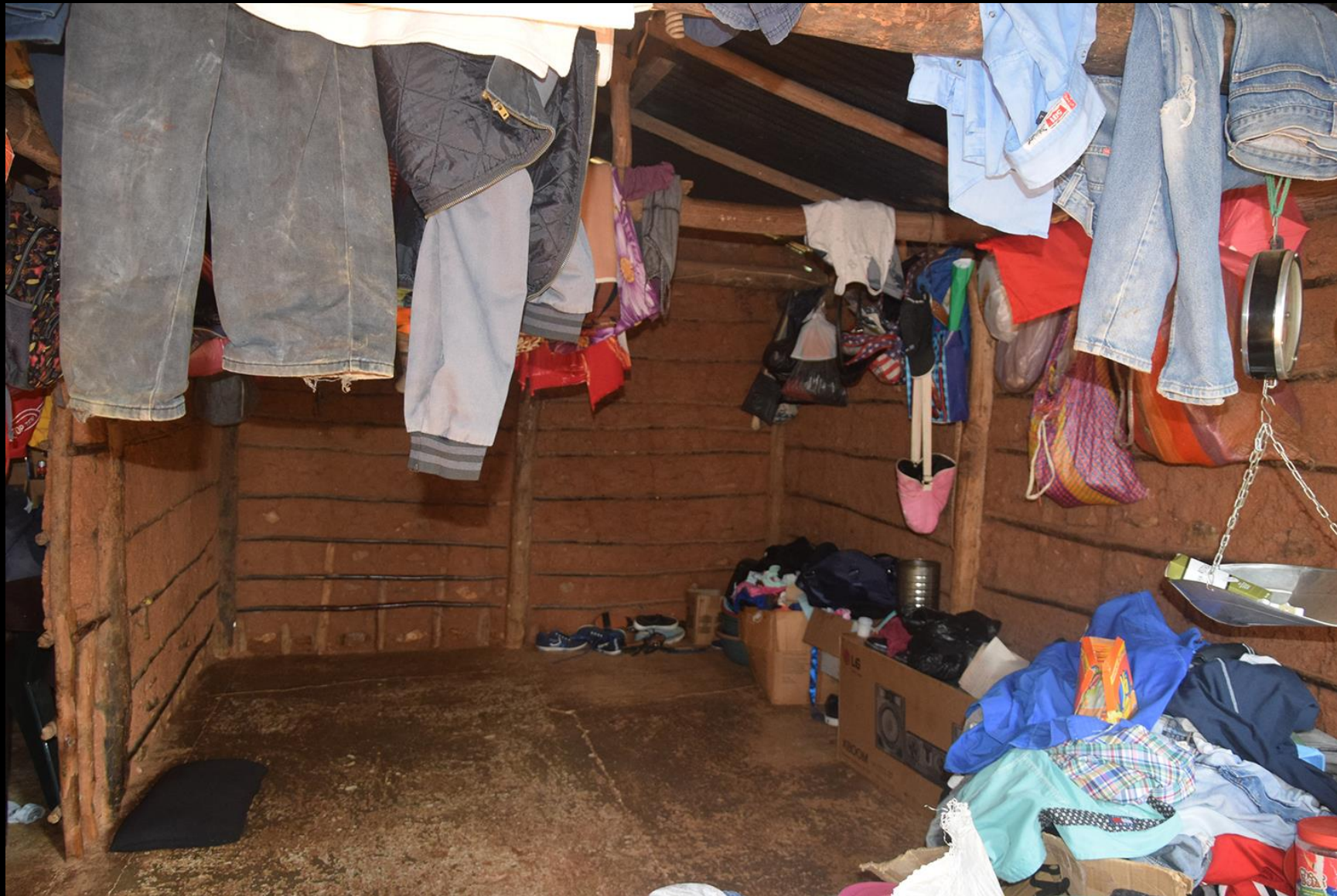
Vivienda 2 (vieja) Interior