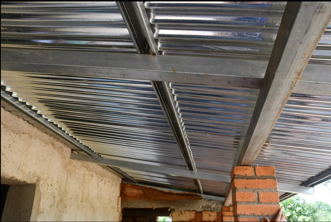
Techo: perlines, zinc y teja