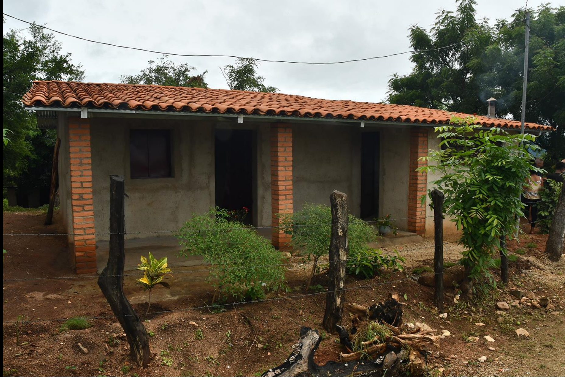
Vivienda nueva construida