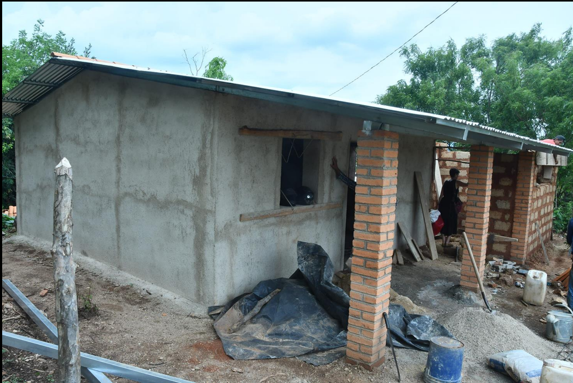
Fase de construcción vivienda 2