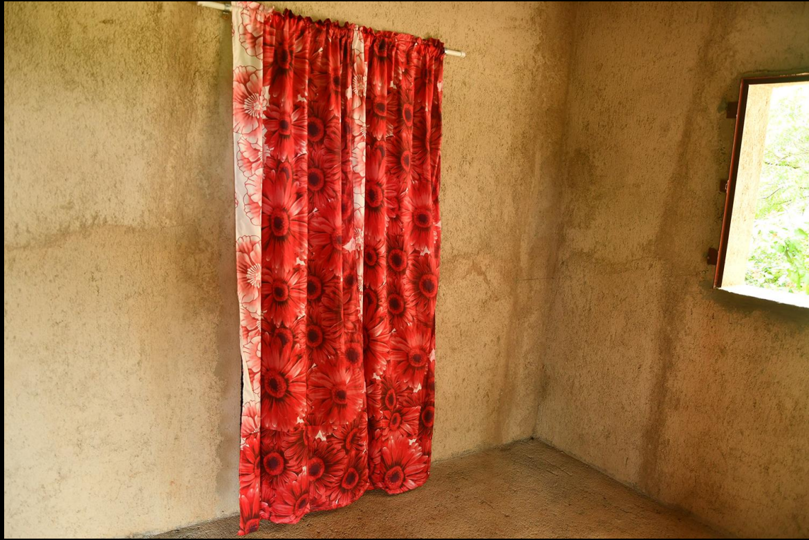
Cortinas habitaciones Viviendas 1 y 2