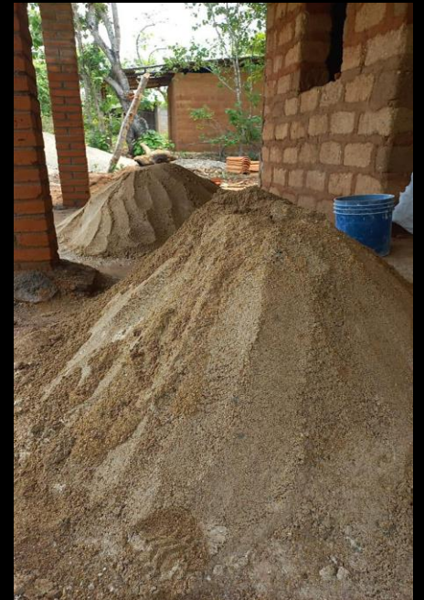
Fase de construcción