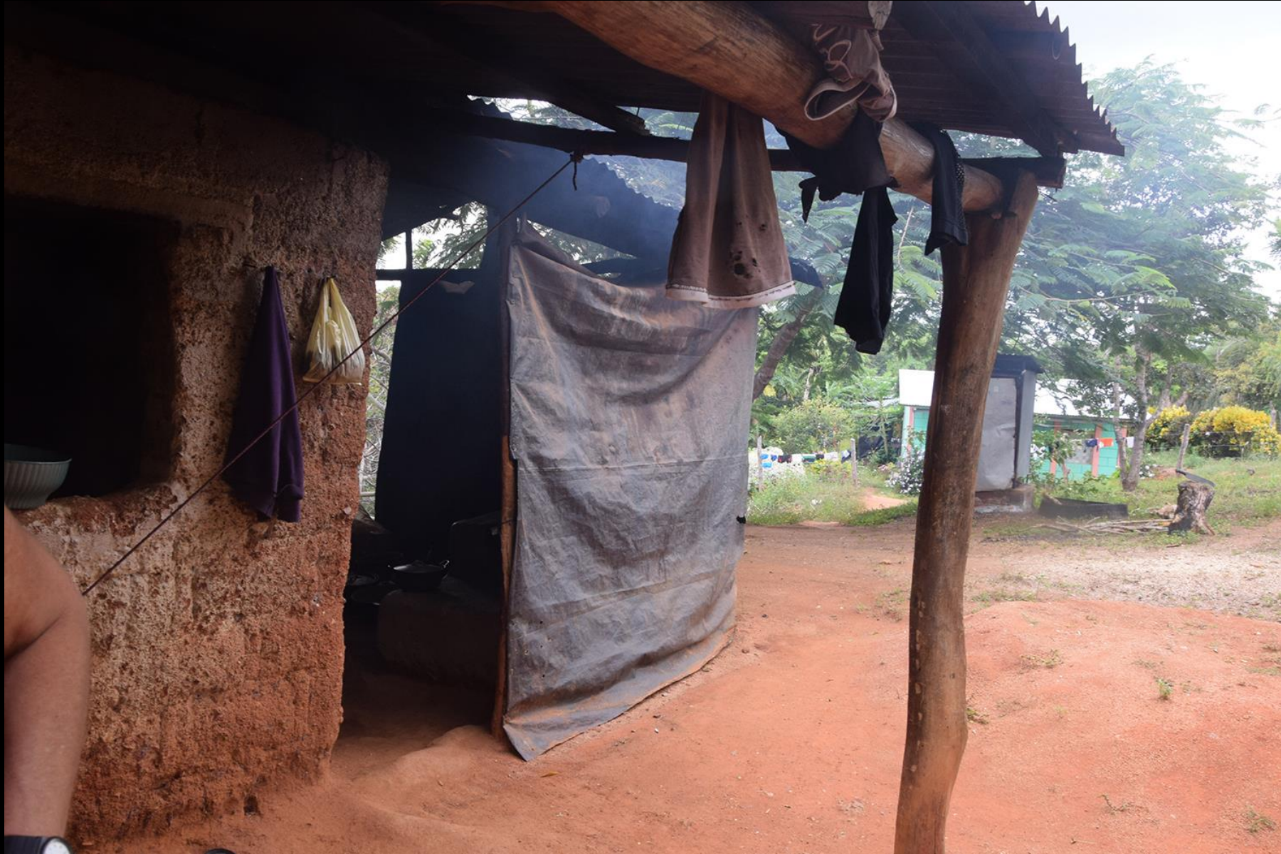
Vivienda 1 (vieja) cocina