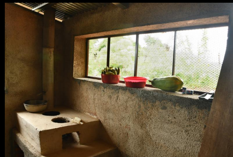
Ventanal de cocina casa 1