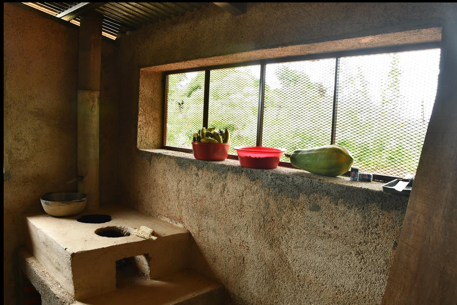
Cocina vivienda 1