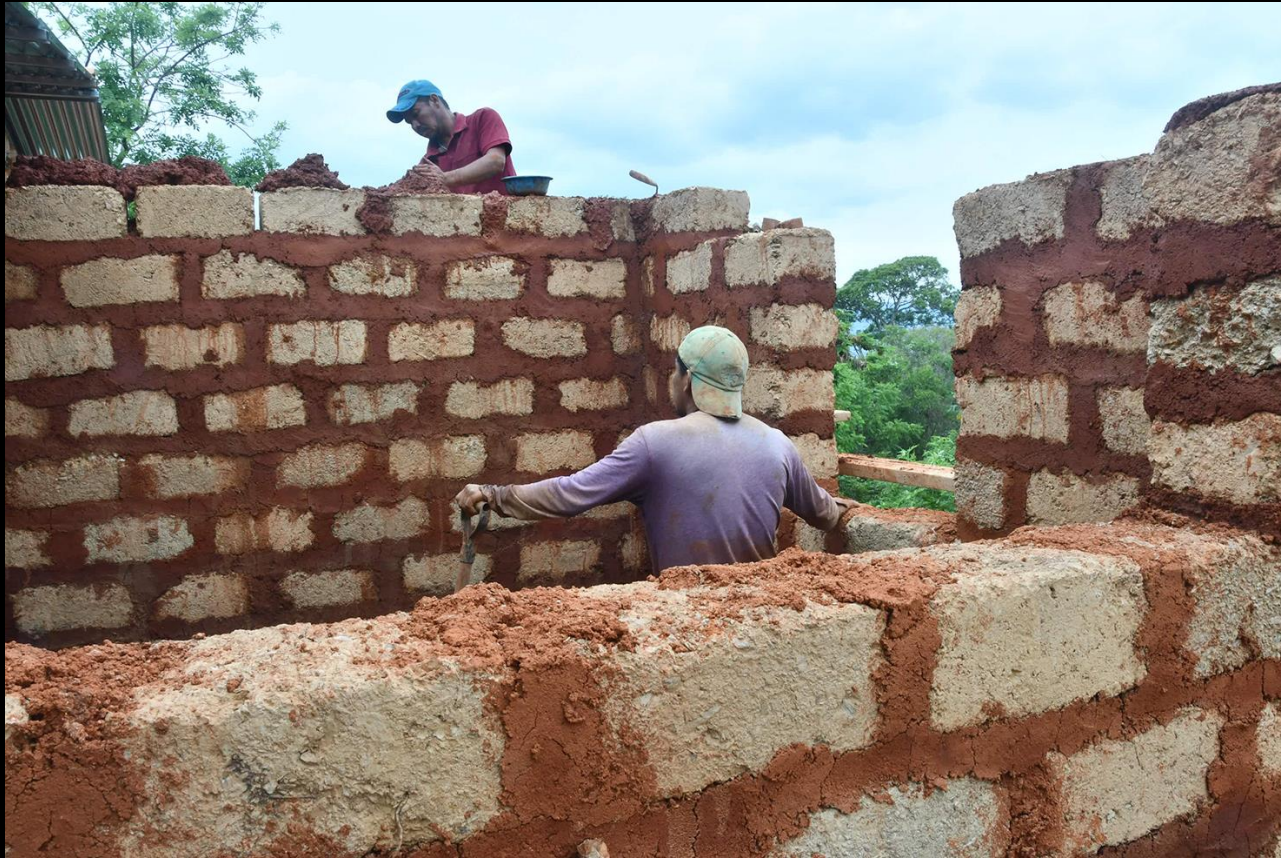
Fase de construcción