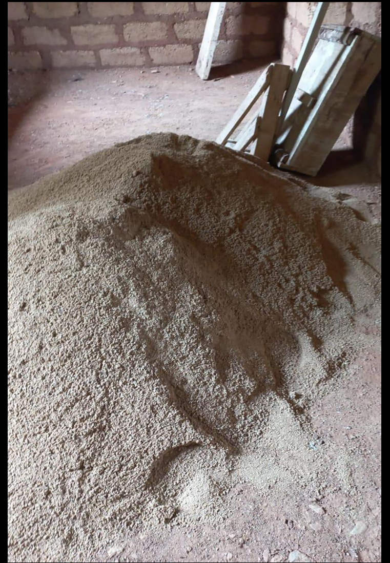
Fase de construcción