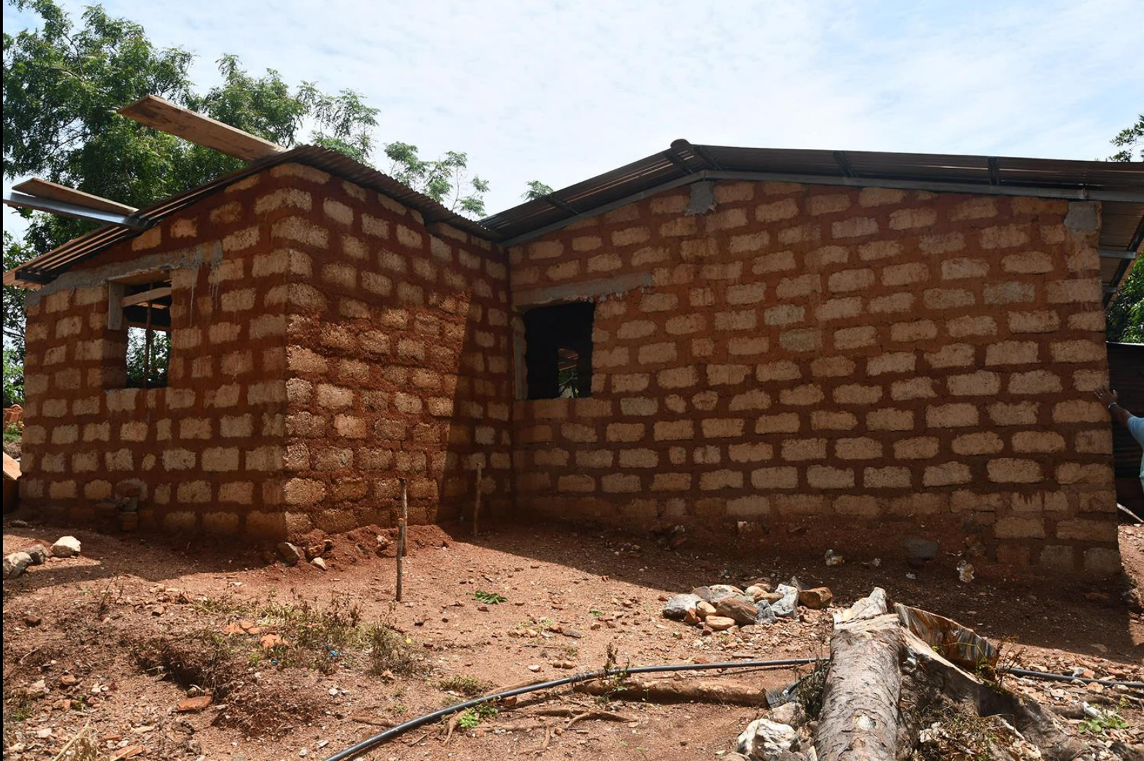
Fase de construcción