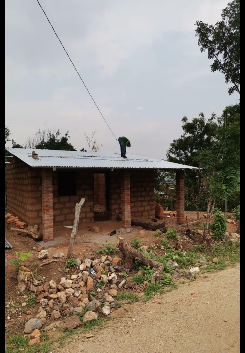
Fase de construcción