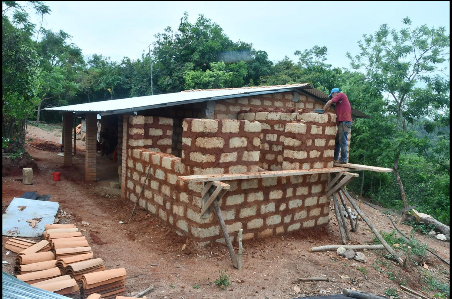
Fase de construcción