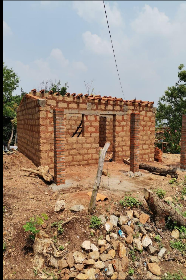
Fase de construcción